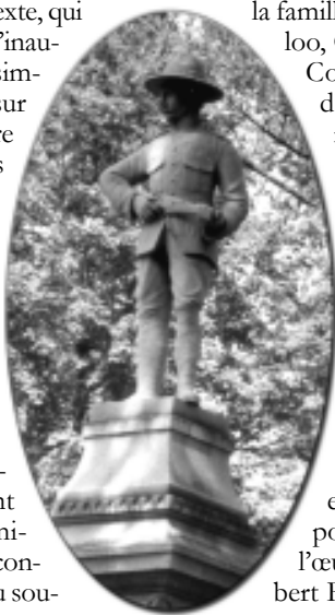
Le monument Latimer, au parc Victoria, rue Dufferin, érigé en 1902.

30 mai suivant, lors des affrontements à Faber Putts, devenant ainsi le premier Canadien à mourir au combat dans ce conflit qui allait durer trois ans. Aussitôt la nouvelle annoncée à