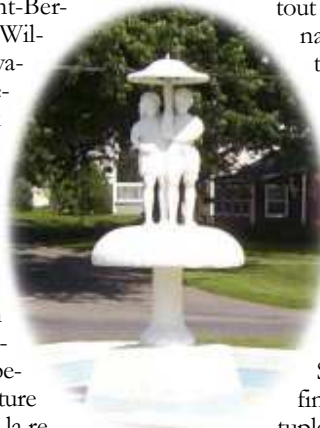
La fontaine inaugurée le 24 juin 1956.

res, situées sur la rue Western, sont alors principalement utilisées pour la culture de légumes et de plants de fleurs. L'œillet est la spécialité de la famille Slack, une production destinée surtout à l'ornementation des gares du Canadien Pacifique. Les frères Slack tentent leurs premières expériences dans la culture du champignon en 1925, dans trois chambres en bois construites à cette intention sur un terrain voisin ; l'initiative se révélant concluante, ils bâtissent trois autres hangars l'année suivante et commencent la production sur une vaste échelle. Ralentie par la Deuxième Guerre mondiale, la champignonnière Slack reprend la production dès la fin du conflit et arrive à la faire quintupler au cours des vingt années suivantes, devenant ainsi un des principaux artisans de la renaissance économique d'une ville qui fut, jadis, après Sherbrooke, la première en importance des Cantons-de-l'Est.