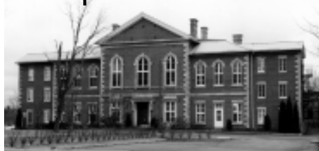
Le palais de justice du district de Bedford, construit à Cowansville, en 1859.

Il incombait au gardien de prison et à son épouse, surnommée la matrone, de voir à l'habillage et au bien-être des détenus, le premier s'occupant des hommes, la seconde des femmes. Outre sa participation à la bonne marche de la prison, la matrone avait également la responsabilité de tenir les livres, y consignait le prix des rations distribuées à chacun des prisonniers. On apprend ainsi qu'au XIX e siècle, selon les années, le prix d'une ration journalière se chiffre entre 10 et 28 cents. Les détenus malades, pour leur part, reçoivent une ration quotidienne d'environ 35 cents, et ce pour toute la durée de leur maladie. De façon surprenante, l'approvisionnement alimentaire de la prison est assuré par le Sheriff du comté, qui a l'obligation d'acheter les provisions aux prix courants en vigueur dans la localité. Pour préparer les repas et chauffer l'édifice, on utilise quelque 100 cordes de bois par année, dont le débitage est fait par les prisonniers dans la grande cour, ces derniers ayant l'obligation de se rendre utiles durant la durée de leur emprisonnement.